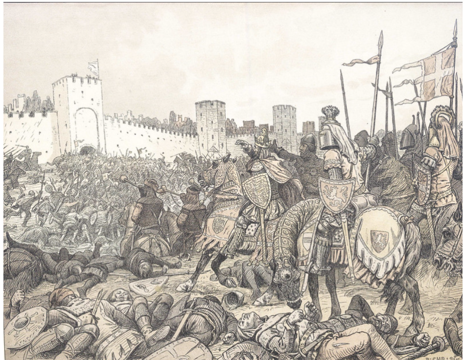
Anskuelsestavle af Rasmus Christiansen, 1891.

Scanner du QR-koden kan du se en YouTube-video. I den ses en rekonstruktion af slaget.