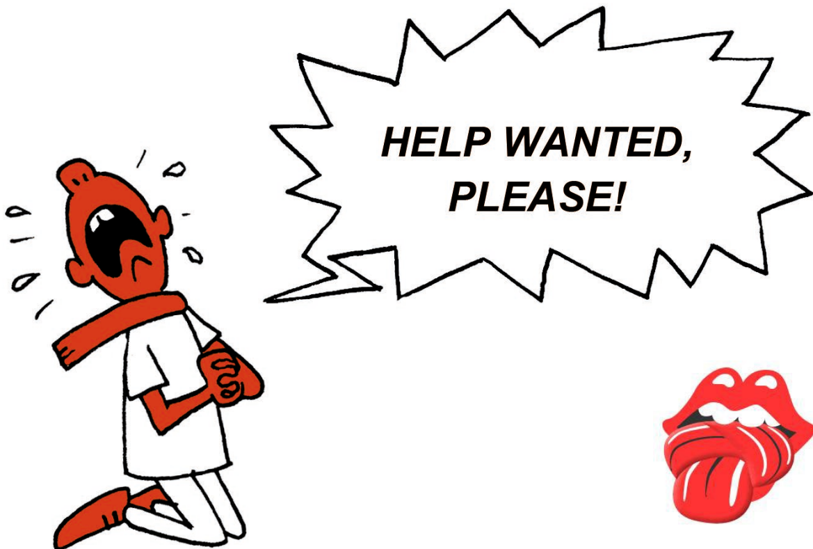
Illustration af www.saxoart.dk