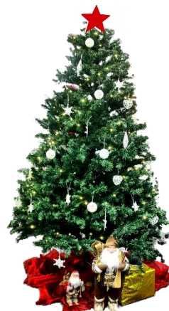
Udgivet på BubbleMinds.dk