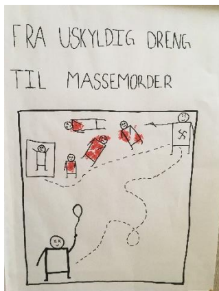
Elevforside: "Fra uskyldig dreng til masse-morder"

Mariegaards udvikling fra bondesøn til krigsforbryder, eller har de en helt tredje vinkel? Sammenlign de færdige resultater og drøft, hvordan det kan være, at resultaterne (sandsynligvis) er blevet så forskellige, som de er.