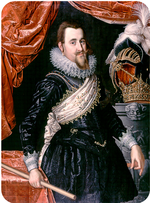
Christian d. 4.

Personen er den konge, der har regeret Danmark i længst tid.