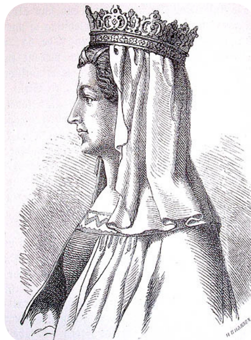
Margrete den I.

Personen deler navn med den nuværende regent i Danmark.